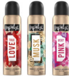
IMPULSE DEO AER 150 ML TRUE LOVE | MUSK | PINK COD: PROMO16

CON LA COMPRA DE 6 DESODORANTES (FRAGANCIA A ELECCIÓN)