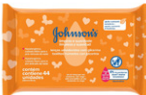
TOALLITAS H.M. LIMPIEZA Y SUAVIDAD 44 un. COD: PROMO17