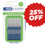
INTERDENTAL EXPERT MINI 3 A 4mm COD: GL05019 10 u

$12.467,50 OFERTA precio con IVA $9.350,63