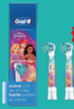
REPUESTO CEPILLO ELECTRICO PRINCESS COD: GL05033 2 u

$41.748,40 OFERTA precio con IVA $31.311,30