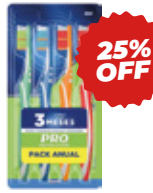
CEPILLO MULTIPLEACCION 40S COD: GL05015 4 u

$9.889,08 OFERTA precio con IVA $7.352,31