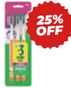
CEPILLO PLUS CUIDADO DE ENCIAS 40S COD: GL05014 3 u

$3.746,72 OFERTA precio con IVA $2.810,04