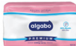
ALGABO ALGODÓN PREMIUM 150 g