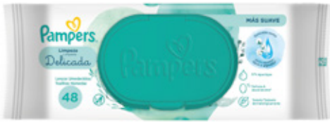
PAMPERS BABY TOALLITAS HM LIMPIEZA DELICADA COD: PROMO14