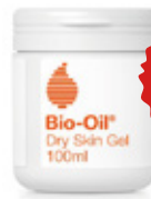
GEL PARA PIEL SECA COD: GL20010 100 ml

$14.606,68 OFERTA precio con IVA $10.224,68